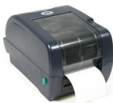
Modeli: LP542TT Termal /etikete