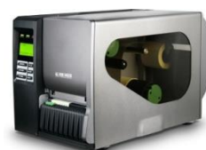
Modeli: SMTPLUSPRO Termal /etikete

*Slike su indikativne. Zadržavamo pravo na tiskane greške.