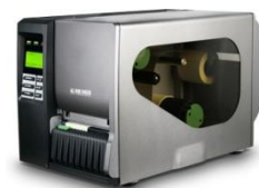
Modeli: SMTPLUSPRO Termal /etikete

*Slike su indikativne. Zadržavamo pravo na tiskane greške.