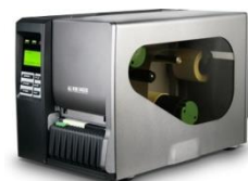
Modeli: SMTPLUSPRO Termal /etikete

*Slike su indikativne. Zadržavamo pravo na tiskane greške.