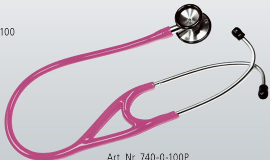
Art. Nr. 740-0-100P