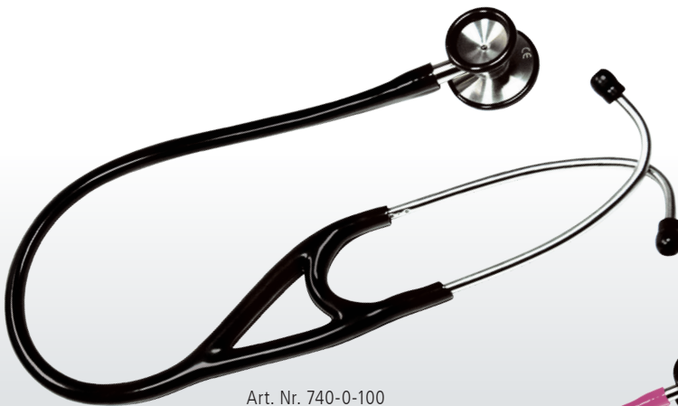
Art. Nr. 740-0-100

... for a perfect auscultation in cardiology as well as pneumology. The very smooth fit of the ear tips together with the individually adjustable headset ensures perfect comfort – disturbing ambient noises are reduced.